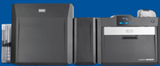
Kartendrucker/Kodierer für beidseitigen Druck mit optionaler Laminierung